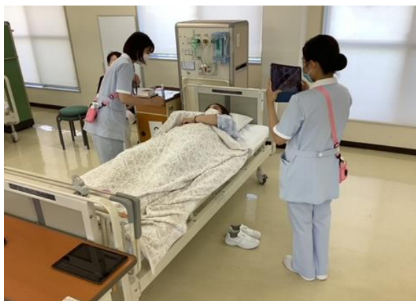
< 援助を撮影中 >

学生は自分の技術を撮影し確認することで、自分の良いところや改善点がわかり、繰り返し練習して技術を習得することに繋がります。この機能をどんどん活用して、技術を磨いていきましょう！